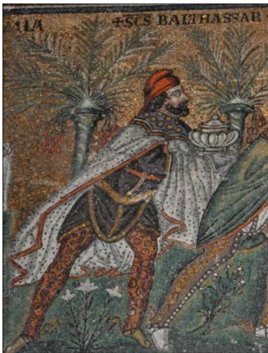
De tre vise mænd tilbeder den nyfødte Jesus. Basilica di S. Apollinare Nuovo, Ravenna 520.

vis, at der ikke er tale om forsøg på en historisk-dokumentarisk redegørelse for de faktiske omstændigheder ved Jesu fødsel, men derimod om formidling af en afgørende vigtig sandhed: at Jesus er Gud fra sin undfangelse