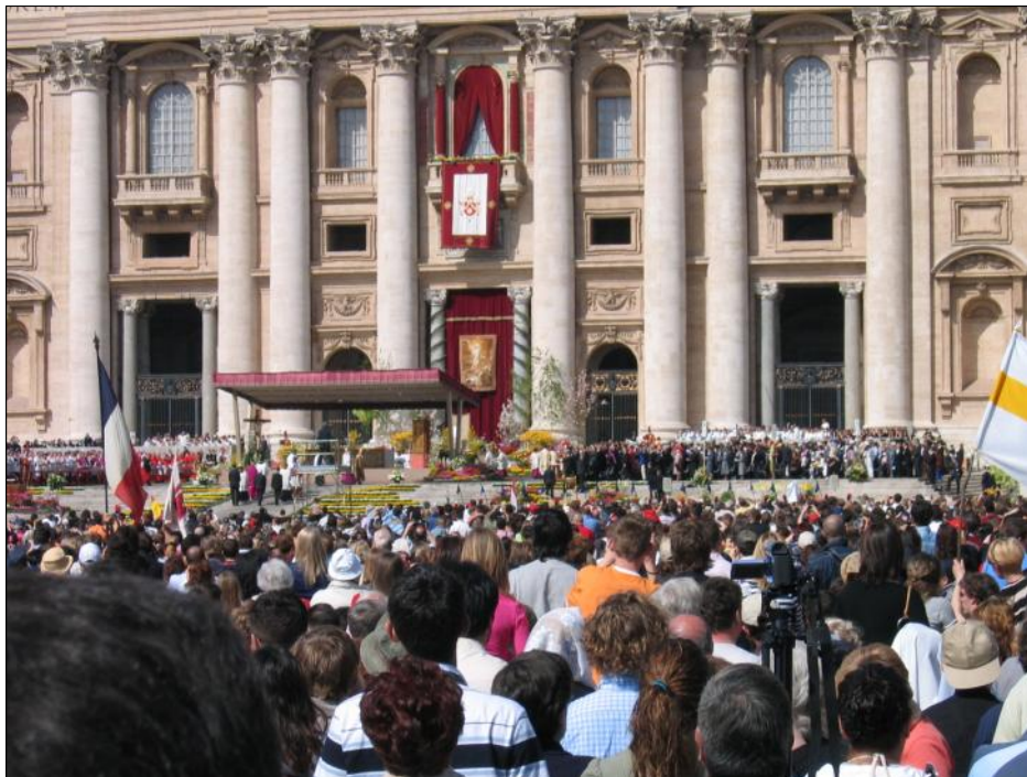
Pladsen foran Peterskirken, Påske 2006.

støtter hele menighedens gudsmøde, hvilket jo er selve formålet.