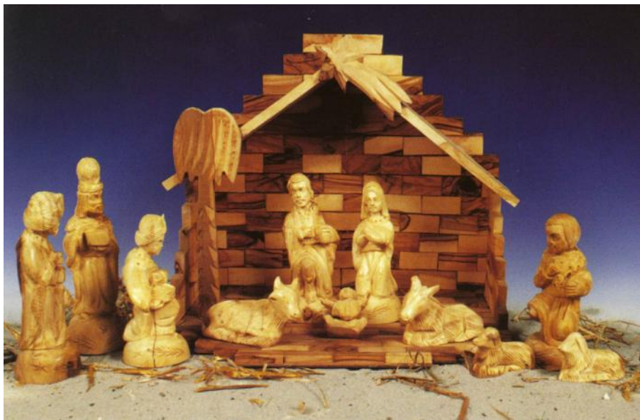
Julekrybbe fra Bethlehem, Israel 1975, skåret i Israels "hellige træ", oliventræet.

I skoven hentede min søster og jeg mange posefulde mos, som efter hjemkomsten blev sirligt draperet foran og rundt om ”stalden”. Figurerne blev formet i ler og kunne bruges år efter år. Mine legetøjsdyr – endog giraf-